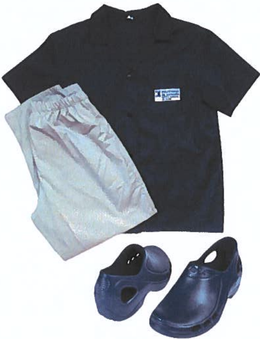
Figura 6 – Fardamento do CTESP em Apoio Domiciliário