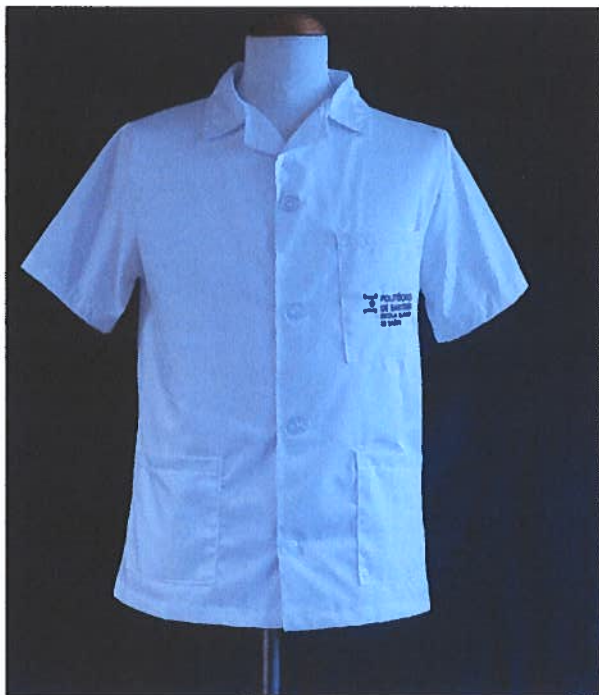
Figura 2 – Túnica Branca com logótipo da ESSS