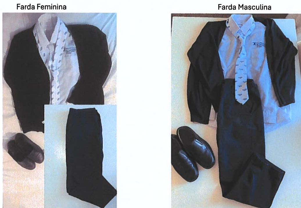
Figura 7 – Fardamento do CTESP em Secretariado em Saúde