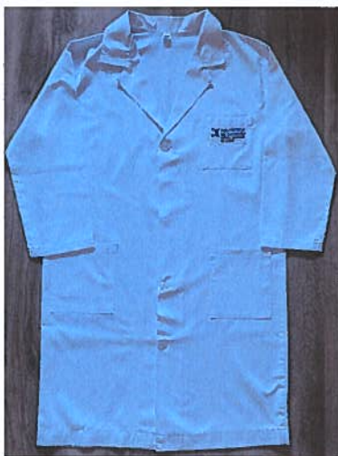
Figura 1 – Bata Branca

4—O modelo da Bata branca é igual para todos os estudantes de todos os cursos da ESSS – características: com altura imediatamente abaixo do joelho, com botões à frente e manga comprida, com o logotipo da ESSS colocado na zona superior esquerda e externa (cf. Figura 1).