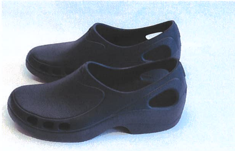
Figura 5 – socas azul-escuras fechadas