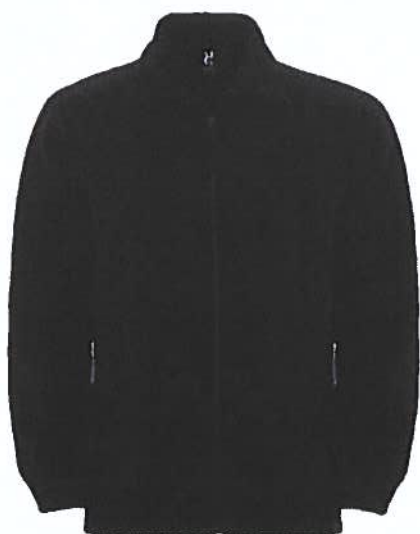
Figura 4 – Casaco de malha Polar azul-escuro