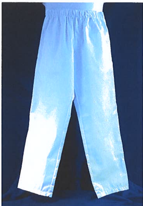
Figura 3 – Calças Brancas